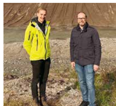
Ortsaugenschein der Räumungsarbeiten beim Schotterfang in Nötsch

Sicherheit hat einen hohen Stellenwert. Darum finden jährlich mit dem Bauhof, den Freiwilligen Feuerwehren sowie weiteren Behördenvertretern Wildbachbegehungen statt. Dies stellt eine unabdingbare Maßnahme zur Feststellung und Beseitigung von Übelständen dar, um die Ortschaften bei Starkregenmengen zu schützen. Hierzu wurde u.a. gemeinsam mit der Wildbach- und Lawinerverbauung der volle Schotterfang des Nötscher Baches ausgeräumt.