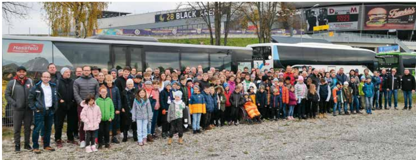
Wir waren mit 3 Bussen und insgesamt über 150 Personen in Klagenfurt vertreten.