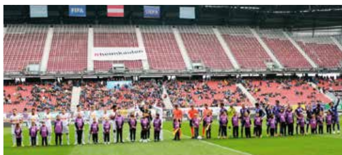
Unsere Einlaufkinder mit Betreuern.