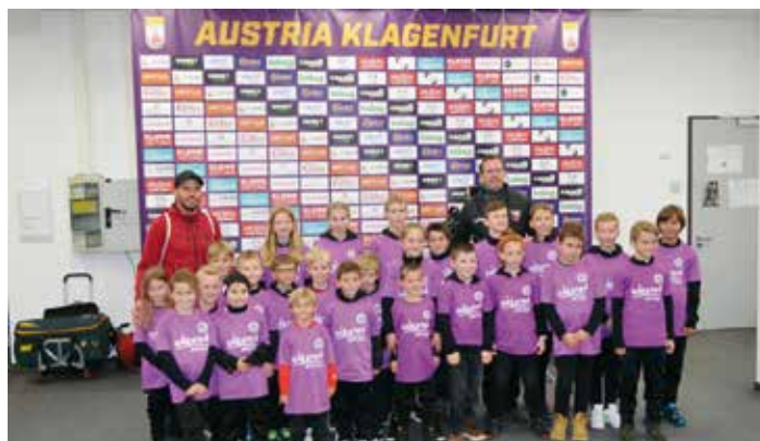
Die Stars von morgen gemeinsam mit den Profis aus Klagenfurt und Salzburg.