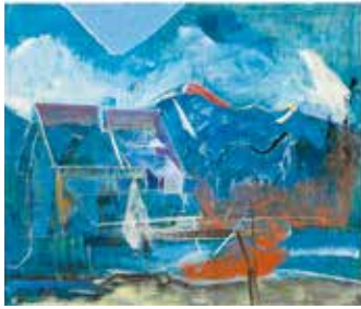
Anton MAHRINGER, Blaue Landschaft II, 1961, Sammlung E. u. H. H.