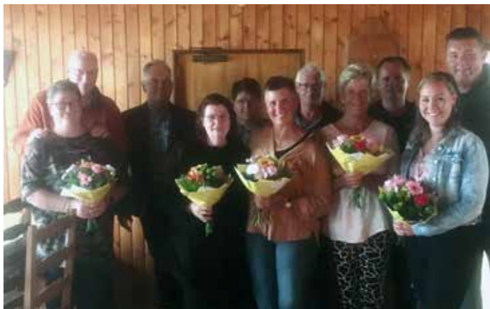
Gästeehrungen Camping Alpenfreude