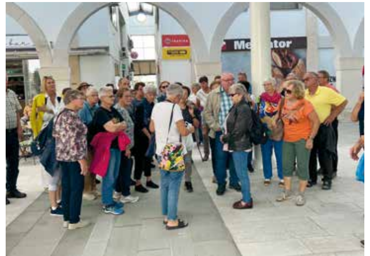
Markthalle in Koper