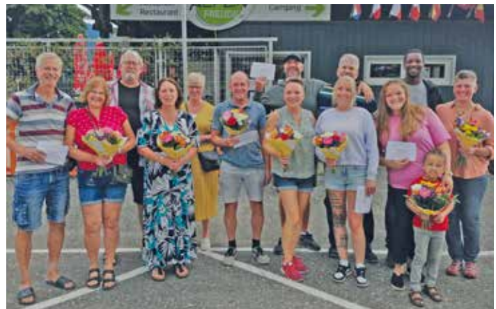
Gästeehrungen Camping Alpenfreude