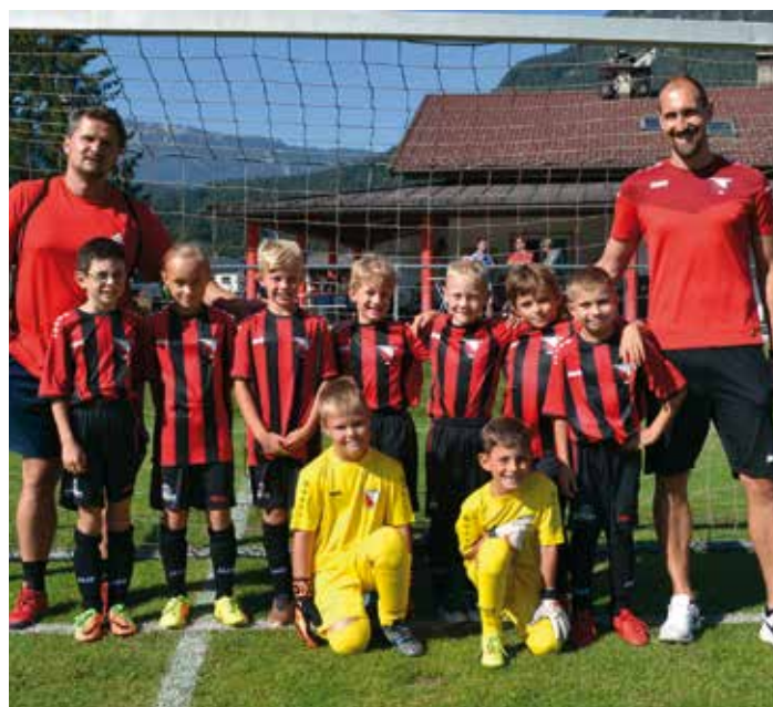
U9-Mannschaft mit Trainern