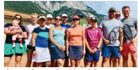
Siegerehrung des Mixed-Doppels

Ein sehr erfolgreiches Tennisjahr für den Tennisclub Nötsch im Gailtal neigt sich dem Ende zu. Es ist allen zu danken, die uneigennützig für den Betrieb arbeiten. So können